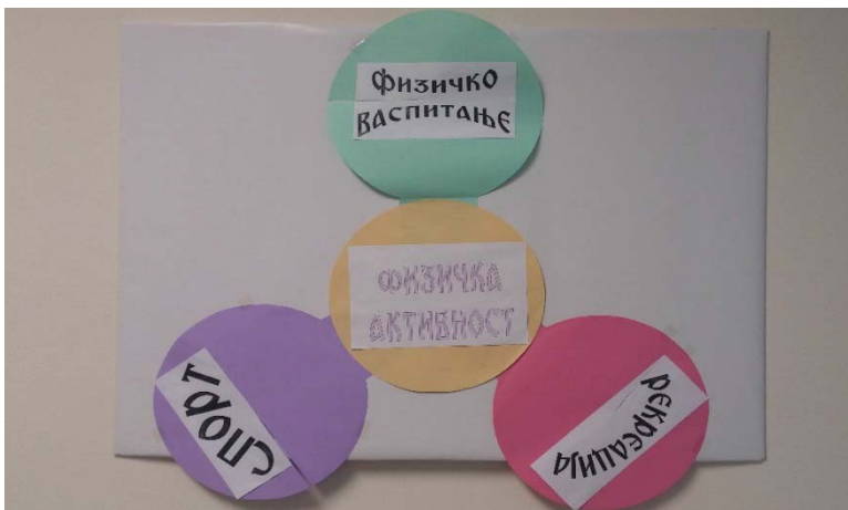
Слика 2 Идеограм структуре физичке културе